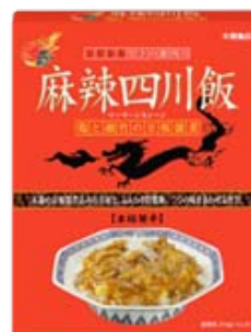
麻辣四川飯 鶏と細竹の豆板醤煮