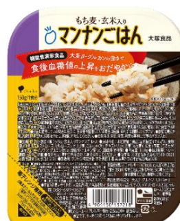
もち麦・玄米入りマンナンごはん