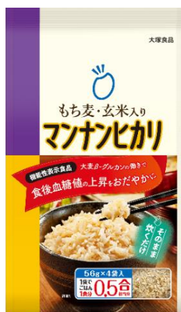
もち麦・玄米入りマンナンヒカリ

大塚食品は今後も『マンナンヒカリ』を通して、おいしく健康的な食生活を提案してまいります。