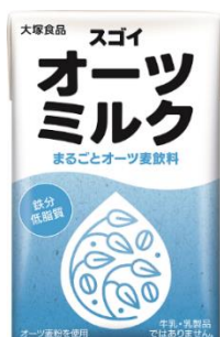
スゴイオーツミルク(125ml)

※2 『スゴイオーツミルク』はオーツ麦粉を、『スゴイひよこミルク』はひよこ豆粉を使用(ひよこ豆のうす皮は除いています)。