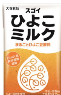
スゴイひよこミルク(125ml)