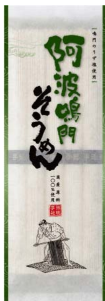
阿波鳴門そうめん

「阿波鳴門そうめん」「阿波鳴門うどん」は、より本格志向、国内産志向を考慮し、国内産小麦と塩(鳴門のうず塩)にこだわり、*圧搾製の米油を使用し、手間暇おしまわず職人が昔ながらの手造りで12工程、約40時間をかけて作りました。艶やかで、しなやかで、もちもち感があり、のどごしの良い美味しさをご賞味いただけます。(*国産原料の新鮮な玄米のぬかに圧力をかけて搾油したものです)