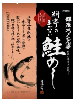
銀座ろくさん亭 まかない鮭めし