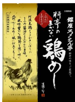
銀座ろくさん亭 まかない鶏めし

『銀座ろくさん亭』シリーズは、道場氏のこだわりそのものである名店「ろくさん亭」が自信を持ってお届けする商品です。